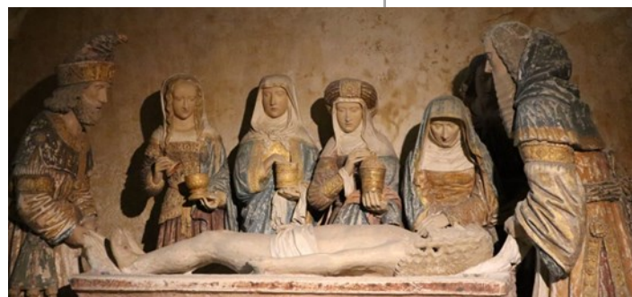
Mise au tombeau construite en 1522 par des ouvriers flamands et qui représente sept personnages grandeur nature.

Rendez-vous à proximité de l'église. Pass sanitaire requis pour la visite de l'église. Gratuit.