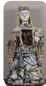
La Vierge ouvrante, de Pierre Amourette

Dimanche 24 juin , à 15 h 30, visite thématique De bric et de broc : « Les Singuliers de l'art récupèrent et détournent les matériaux. Ce parcours thématique propose de découvrir l'originalité et l'inventivité de ces créateurs détourneurs d'objets ». Tarif : 3 euros.