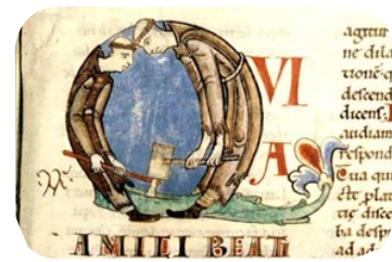
Frères convers (enluminure cistercienne)