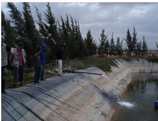
L'eau, pompée à 200 m de profondeur, est stockée dans un bassin avant d'être répartie vers les exploitations agricoles.

Ils ont même transmis des savoirs et des responsabilités aux plus jeunes, assuré la