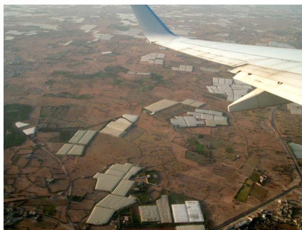
Des centaines d'hectares de serres copieusement irriguées...

Alors je me suis dit qu'il fallait absolument qu'un maximum de mes concitoyens puissent voir ce que peuvent faire des hommes de bonne volonté, qu'ils voient pour comprendre que nous avons beaucoup de chance. Qu'ils se souviennent de leurs propres ancêtres qui ont inventé l'économie sociale. Et qu'ils l'expliquent à leurs enfants avant qu'il ne soit trop tard.