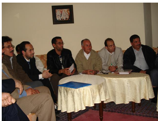
Le CÉAS a rencontré les élus d'Oued Essafa.