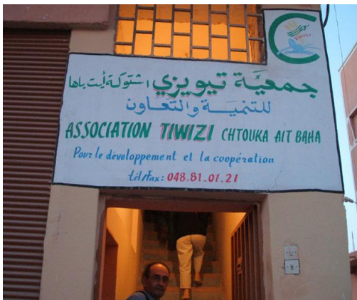
Siège social de l'association Tiwizi.

Située au sud-est d'Agadir, la province de Chtouka-Aït Baha compte près de 300 000 habitants en 2004, dont 13 % vivent dans deux communes urbaines. La commune rurale Oued Essafa, quant à elle, compte