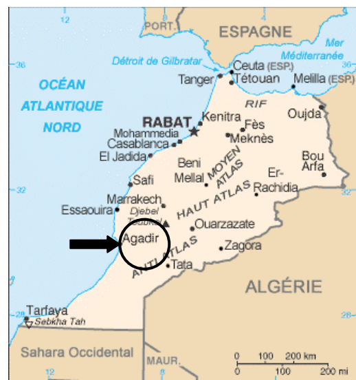
Province de Chtouka-Aït Baha.

Décidément, les Berbères ne sont pas encore une espèce en voie de disparition et ils peuvent encore modeler le visage du Maghreb de demain.