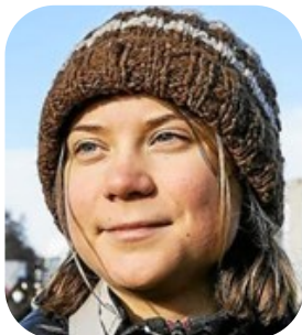
Pour Greta Thunberg, sa différence, c'est son superpouvoir !

reste ouverte malgré les menaces et risques de représailles. Malala, 11 ans, apporte son témoignage aux médias : « L'école, c'est mon rêve. Je veux apprendre pour faire quelque chose de ma vie ». Pour les talibans, cette provocation est inqualifiable. Le 9 octobre 2012, le bus qui la ramène de l'école est délibérément mitraillé. Elle est très grièvement blessée. Prix Nobel de la paix à 17 ans, en 2014, elle poursuit sa bataille pour l'éducation.