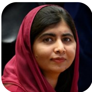
Malala Yousafzai, prix Nobel de la Paix à l'âge de 17 ans

Malala Yousafzai nous plonge dans le Pakistan de 2007. Les femmes y sont inférieures aux