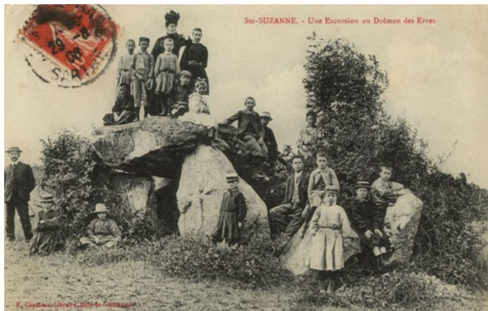
L'intérêt pour les mégalithes n'est pas nouveau !

monuments les plus connus, celui des Erves, à Sainte-Suzanne ; l'allée couverte de la Contrie, à Ernée ; la Hamelière, à Chantrigné ; ou encore le Petit-Vieux-Sou, à Brécé, et la Louvetière, à Saint-Mars-sur-la-Futaie.