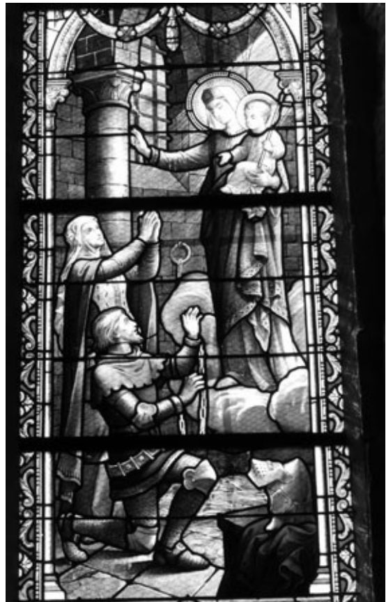
À l'église, un vitrail du XIX e siècle conserve le souvenir du château de La Gravelle : la Vierge Marie délivre le baron de Sillé-le-Guillaume, prisonnier au château durant la guerre de Cent Ans.