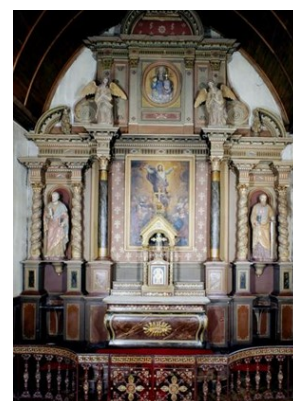
Le retable du maître-autel (XVIII e -XIX e siècle)

Rendez-vous devant l'église. Plein tarif : 5 euros ; tarif réduit : 3,50 euros ; gratuit pour les moins de 18 ans et les étudiants.